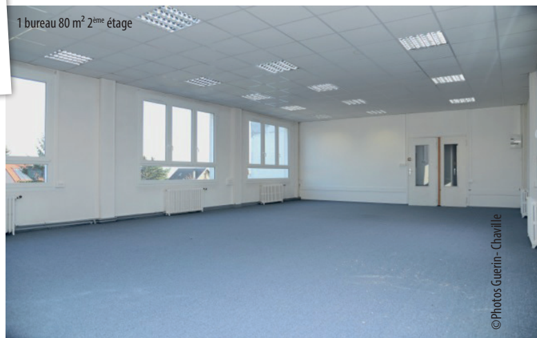
1 bureau 80 m 2 2 ème étage